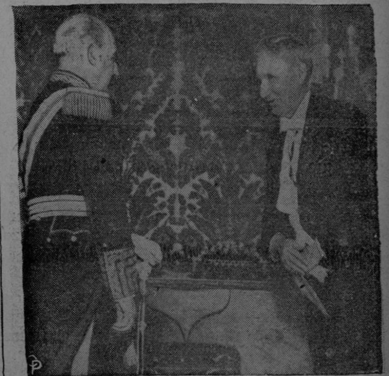
El nuevo Embajador de los Estados Unidos en España, Lincoln MacVeagh (derecha) hace una cortesía al presentar sus credenciales al generalísimo Francisco Franco en Madrid. MacVeagh representaba anteriormente a los Estados Unidos en el Portugal, (INF).